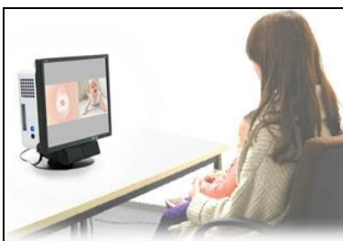
図1 Gazefinder®の小児への実施の様子（母が児を抱っこして検査実施）

幼児の社会性を客観的に測定することを目的として、大阪大学大学院 大阪大学・金沢大学・浜松医科大学・千葉大学・福井大学 連合小児発達学研究所と株式会社 JVC ケンウッドが共同で開発したモニターとカメラが一体化した視線計測器です。難しい準備を必要とせず、約2分間の映像を眺めてもらうだけで、社会的情報への注視が客観的な数値として測定できます。結果は自動的に算出されるので、実施後すぐに確認できます。